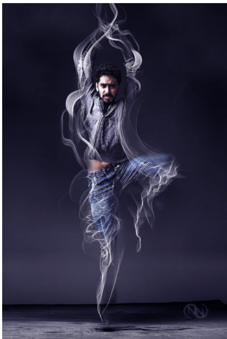
Smoke. Kunstenaar: Nlunga Nijanda