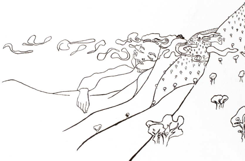
Kunstenaar: Anuja 'In nevelen gehuld'.

In 2025 heeft de stichting de ANBI-status verkregen, waardoor de stichting vanaf 25 juli 2025 door de Belastingdienst is aangemerkt als culturele instelling. Door deze status zijn de belastingregels voor algemeen nut beogende instellingen (ANBI) op het gebied van schenking, successie en de aftrek van giften (inkomsten- en vennootschapsbelasting) van kracht.